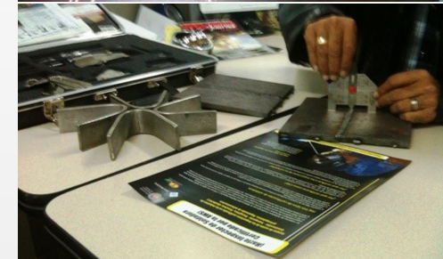
AWS Signs On an International Agent in Colombia