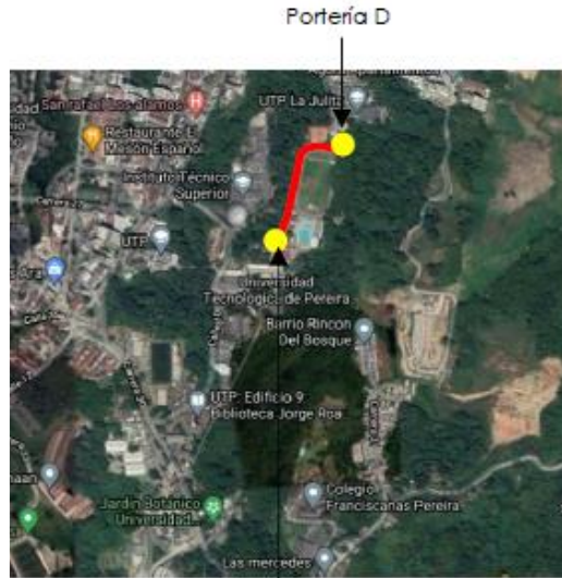
Edificio 1B Ingeniería Eléctrica