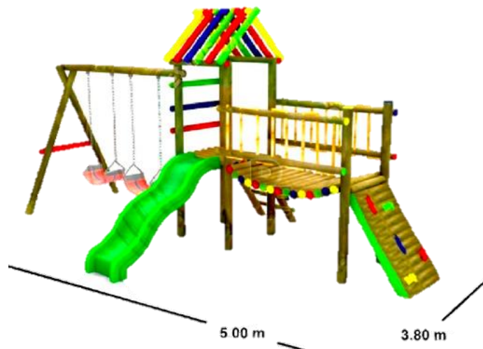
Parque Infantil tipo 2