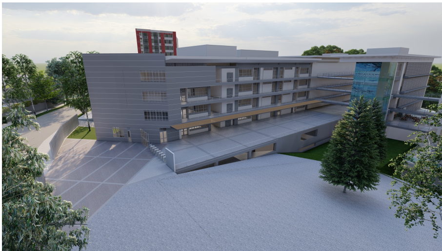
Vista General Bloques A y B