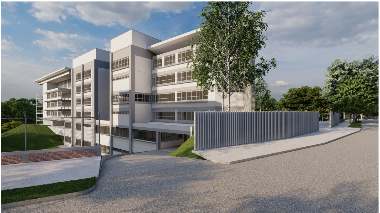
Vista Fachada Posterior.

Animación del proyecto: https://www.youtube.com/watch?v=dp2Rufmflo