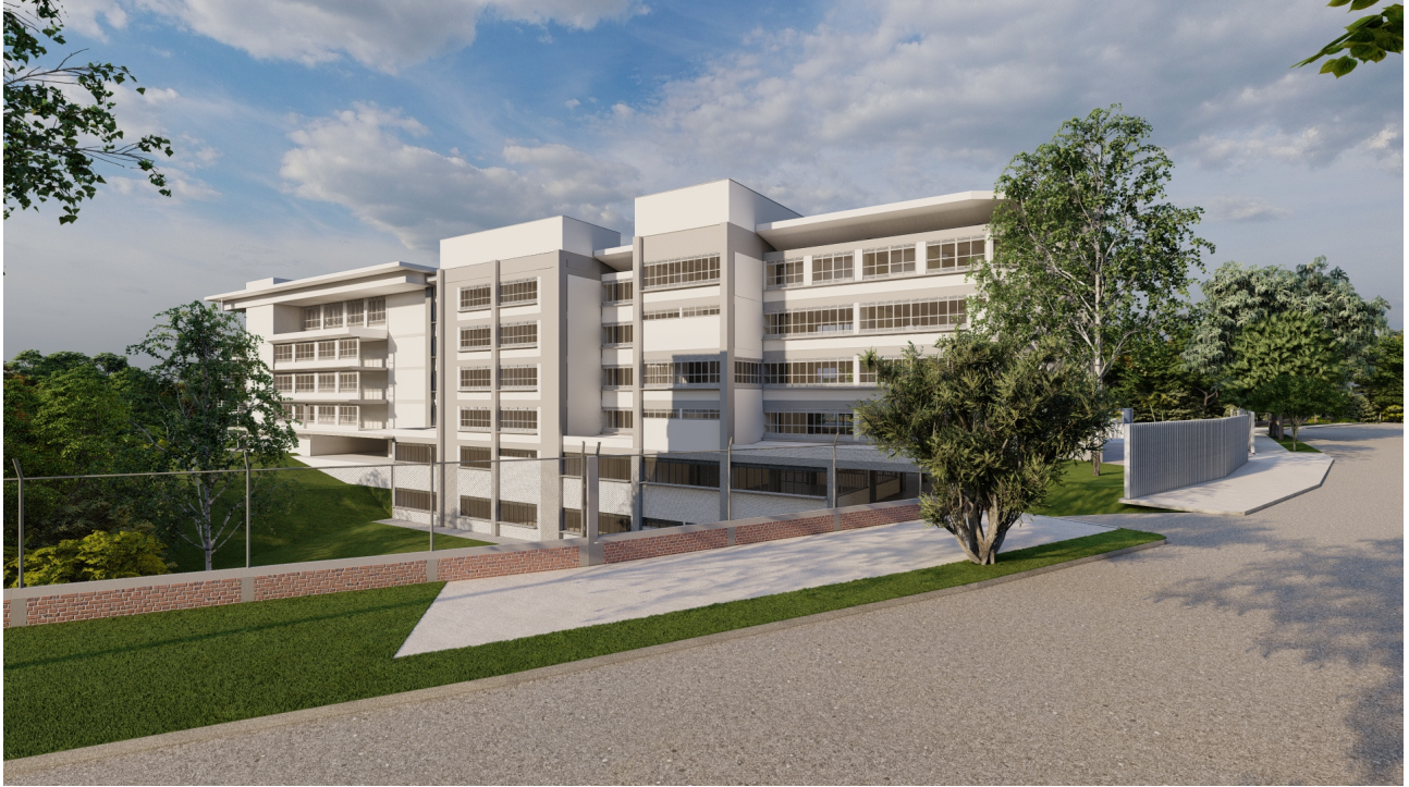
Vista Fachada Posterior.